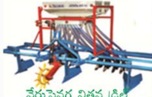
వేరుసెనగ విత్తన డ్రిల్ (గొర్రు)