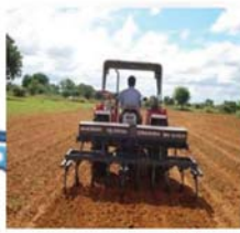
వేరుసెనగ విత్తనం వేసే యంత్రం