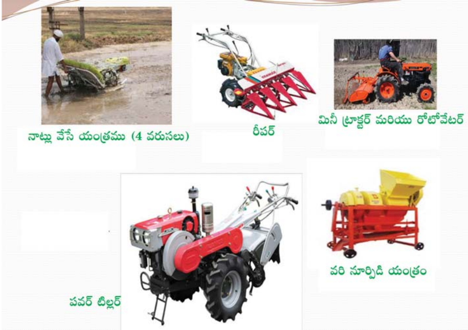
నాట్లు వేసే యంత్రము (4 వరుసలు)