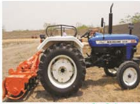
ట్రాక్టర్ మరియు రోటోవేటర్