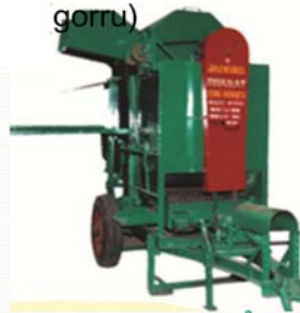
వేరుసెనగ నూర్పిడి యంత్రం